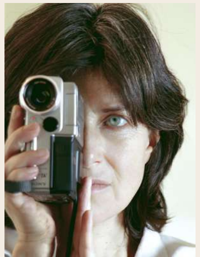
RÉTROSPECTIVE CHANTAL AKERMAN